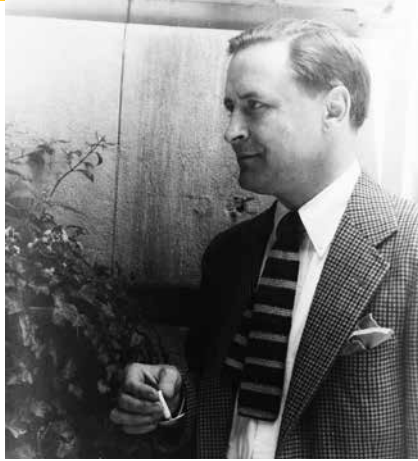
Francis Scott Fitzgerald (1896-1940)