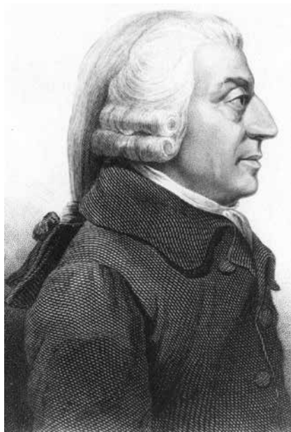
Adam Smith (1723-1790) gravure 1787

déboucher sur un consensus dans ce domaine car la réflexion économique a pris son autonomie par rapport à la morale. La crise récente a braqué les projecteurs sur ce divorce. Faute d'un principe d'équité et de responsabilité socio-économique, les marchés se sont financiarisés et l'appât du gain a succédé au « doux commerce ». De la Grèce antique à l'Europe du Moyen Âge l'analyse économique était une branche de la morale et de la théologie. Et pour Adam Smith, l'un des pères fondateurs de la science économique, l'économie qu'il analysait dans La richesse des nations 2 n'était pleinement efficace dans la production et la distribution de richesses, au sein d'une société et d'un État bien gouvernés, que si elle reposait sur un socle moral solide et généralisé, celui qu'il décrivait dans Théorie des sentiments moraux 3 . Les phases d'essor de l'économie marchande ont conduit l'économie à devenir politique en raison de son rôle