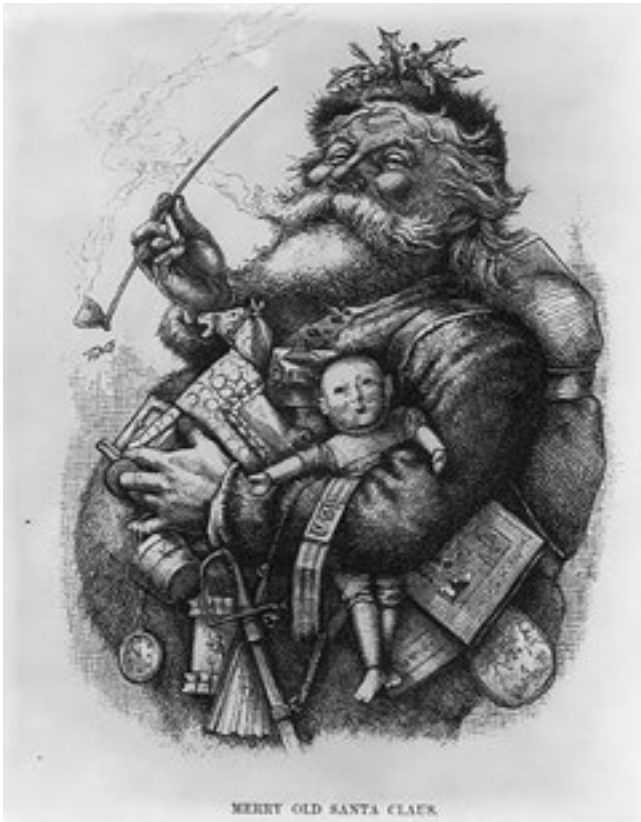
Thomas Nast. Gravure sur bois, 1889.